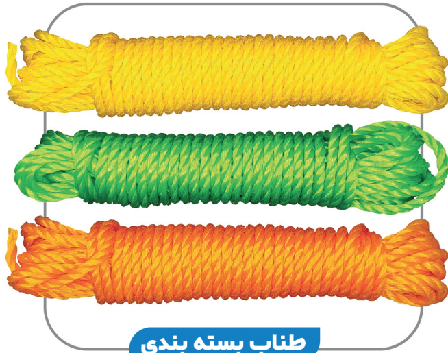
طناب بسته بندی