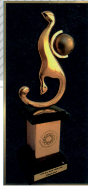
دریافت لوح و تندیس صادر کننده نمونه استان اصفهان