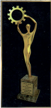
دریافت لوح و تندیس جشنواره مدیران برتر کشور