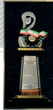
دریافت لوح تقدیر از سازمان صنعت و معدن و تجارت