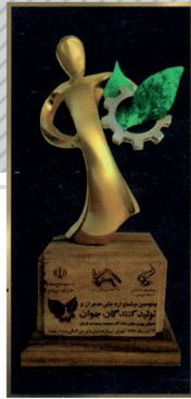
دریافت لوح و تندیس مدیر نمونه جوان کشور