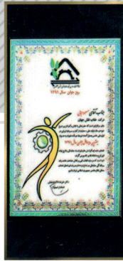
دریافت لوح و تندیس مدیرعامل نمونه جوان استان اصفهان